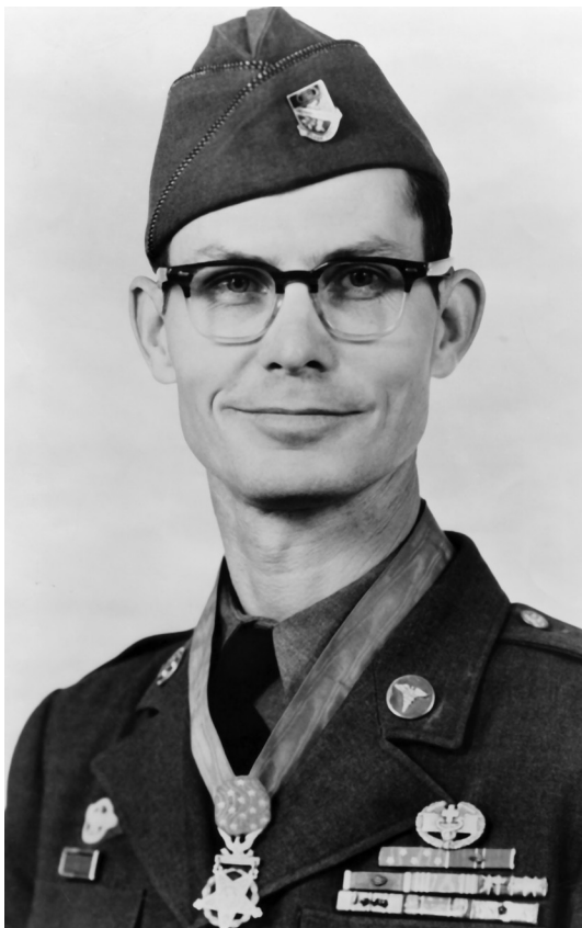
Il caporale Desmond T. Doss con la Medaglia d'Onore del Congresso ricevuta dal presidente Harry S. Truman.