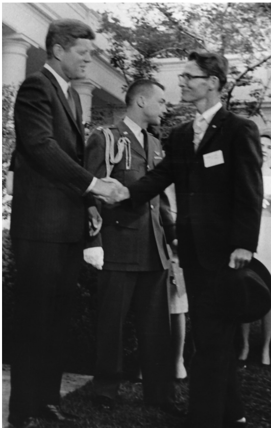
La Medal of Honor Society scelse Desmond Doss come rappresentante di tutti i decorati con la Medaglia d'Onore alla cerimonia presso la Casa Bianca, durante la presidenza di John F. Kennedy.