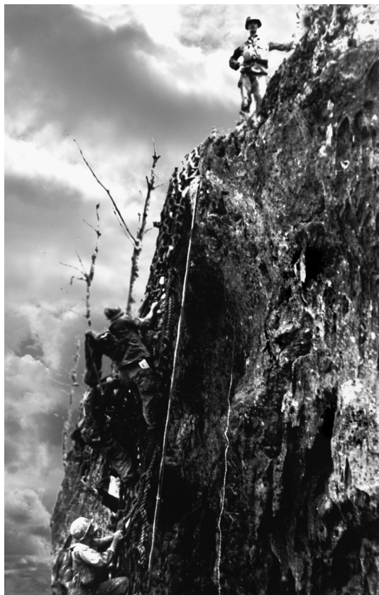
Desmond Doss sulla cima dell'Hacksaw Ridge, sull'isola di Okinawa. Si era offerto volontario per proteggere le reti da carico.